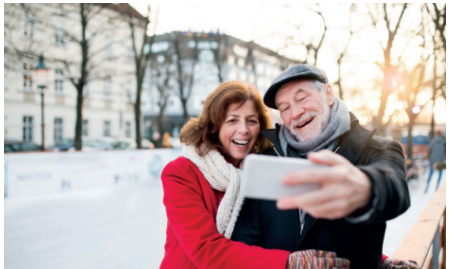
Las nuevas tecnologías ayudan a que las personas mayores tengan una vida activa

Asimismo, hay un convencimiento unánime en la falta de claridad en la existencia de los derechos humanos de las personas mayores, a diferencia, por ejemplo, de los niños, mujeres y personas con discapacidad. Junto a ello, el discurso