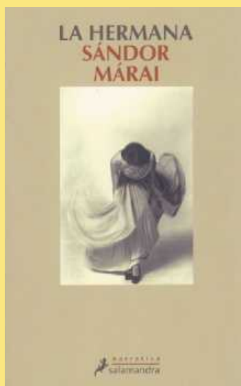
La hermana Sandor Marai Editorial Salamandra 256 págs. 14,80 euros.