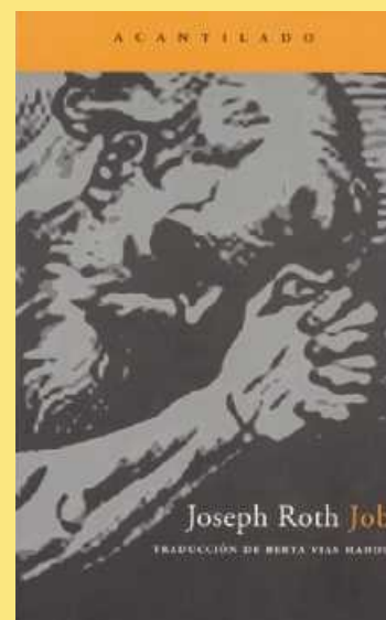
Job Joseph Roth. Editorial Acantilado 224 págs. 16 euros