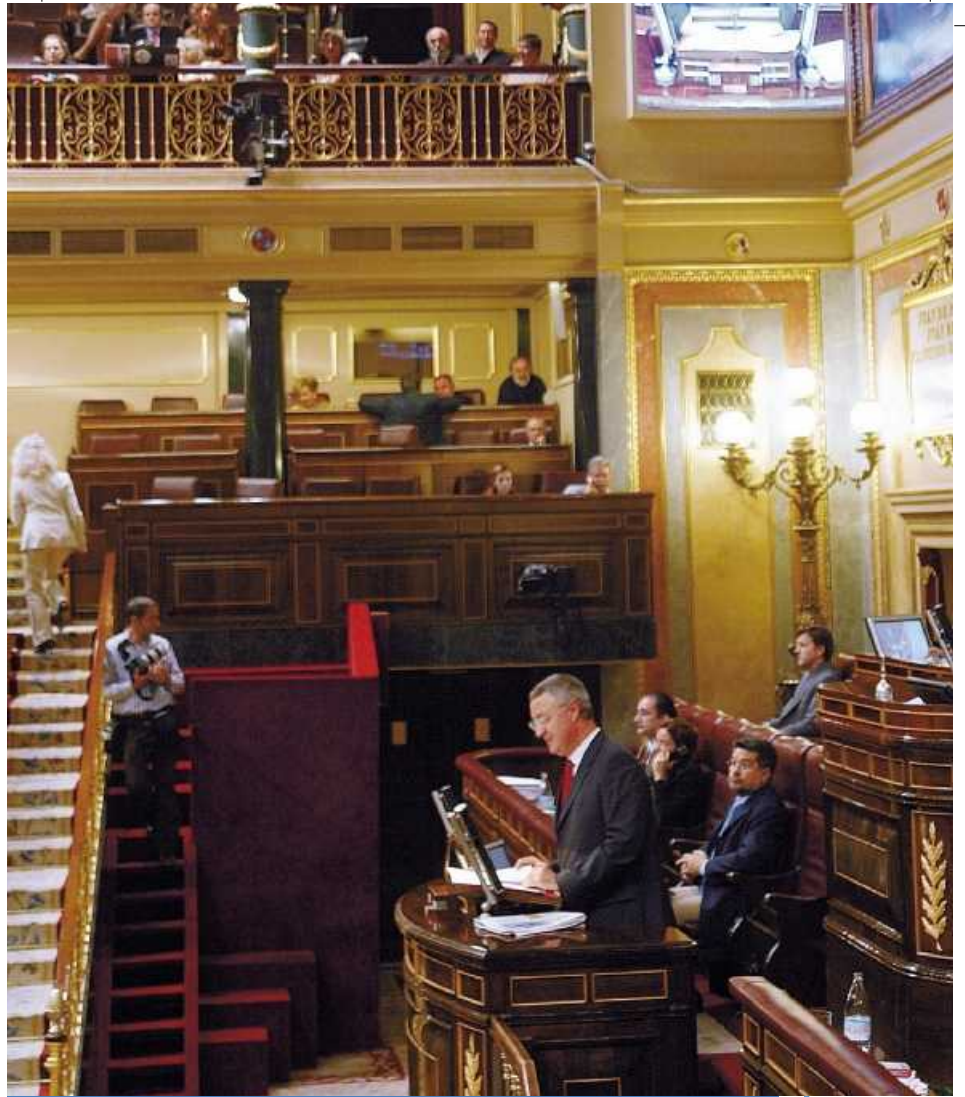
Intervención del ministro de Trabajo y Asuntos Sociales, Jesús Caldera y otros momentos del debate del proyecto de ley

Para poner en marcha el SAAD, el Gobierno aportará más de 12.638 millones de euros hasta el año 2015 y garantizará la igualdad de todos los ciudadanos con independencia del lugar donde residan, mediante la financiación del contenido básico del derecho.