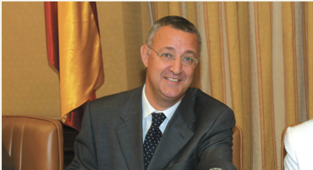
Jesús Caldera durante su comparecencia en la Comisión de Trabajo y Asuntos Sociales en el Congreso

El ministro de Trabajo y Asuntos Sociales compareció en el Congreso para exponer las líneas generales del proyecto de Ley de Promoción de la Autonomía Personal y Atención a Personas en Situación de Dependencia, el pasado mes de mayo.