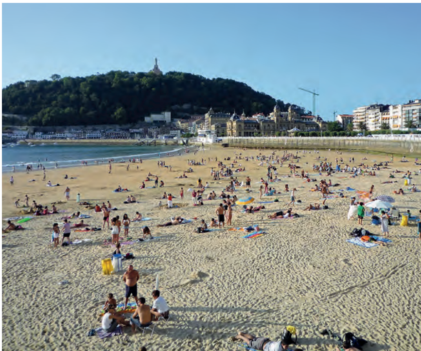
Donostia-San Sebastián fue pionera incorporándose a la Red en 2008.

Sin embargo, en Iberoamérica todavía son muy pocos los municipios incorporados a este proyecto, entre ellos, Argentina, Méjico y Chile, con un ayuntamiento de cada uno de estos países adherido a la Red.