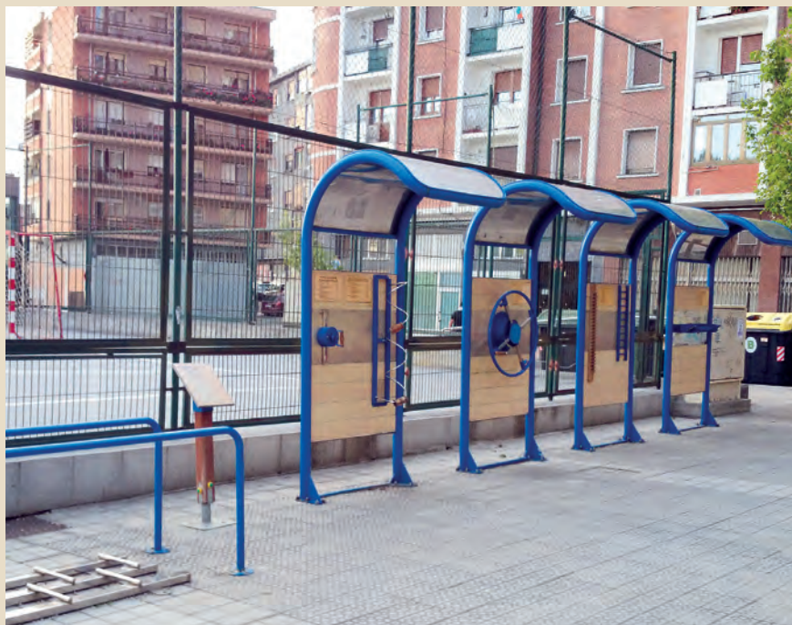
Espacios al aire libre del entorno urbano que influyen en la salud y calidad de vida de las personas.

adheridos a la Red de Ciudades y Comunidades Amigables con las Personas Mayores. Con el objetivo de facilitar la difusión on-line y la información sobre la Red se elaboró un folleto informativo disponible también en el Portal de Ciudades Amigables, para su libre uso por parte de todas aquellas entidades y organismos que quieran contribuir a su difusión. Todos estos documentos están disponibles en el portal: www.ciudadesamigables.imserso.es