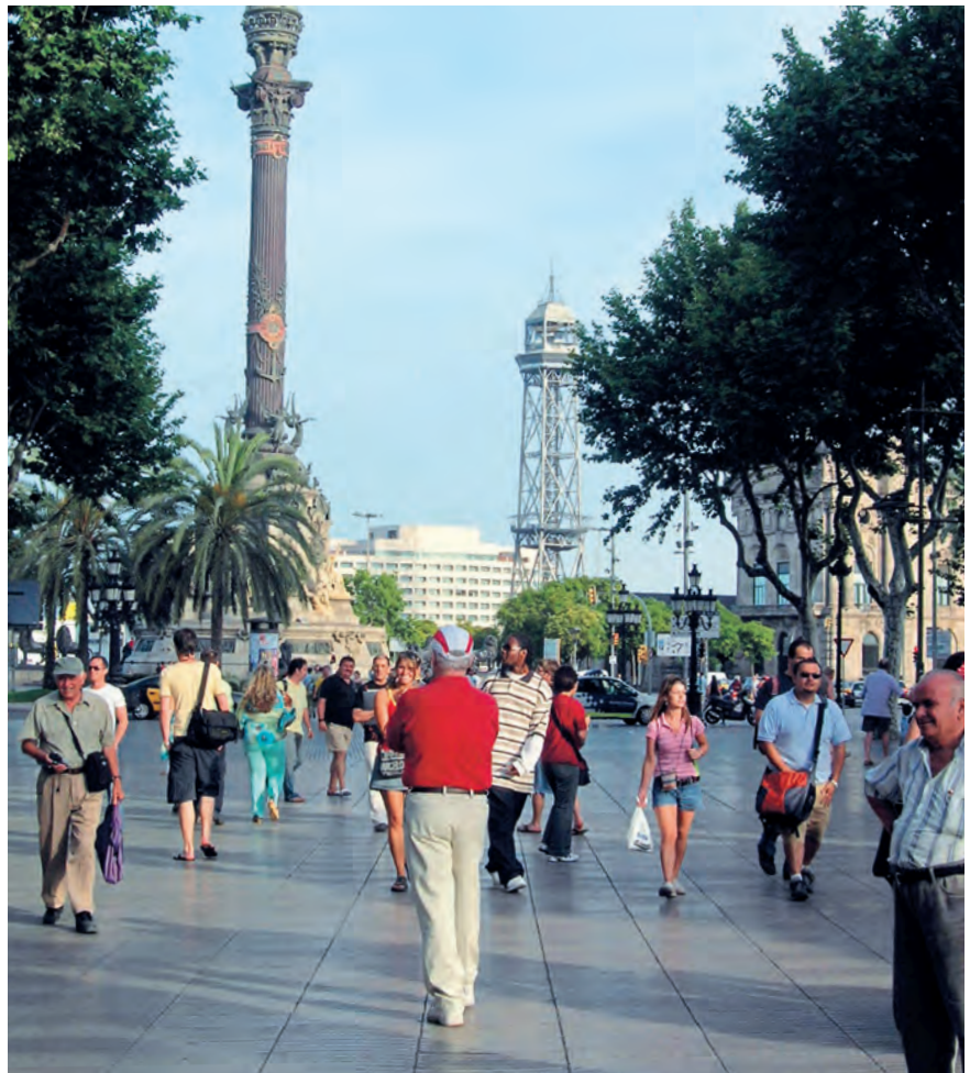
La ciudad de Barcelona, otra de las pioneras.