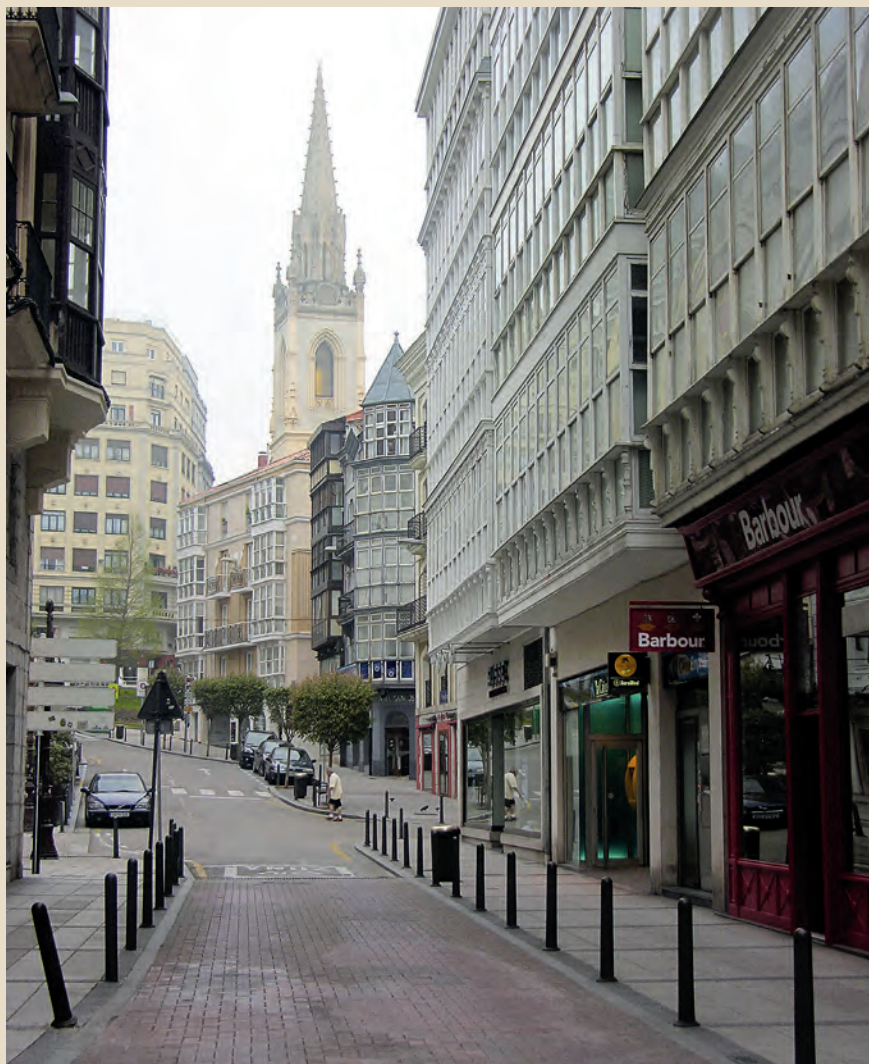
Santander pertenece también a la Red.

“ Los ayuntamientos interesados en adherirse a la Red se comprometen a promover la participación de las personas mayores durante todo el proceso”