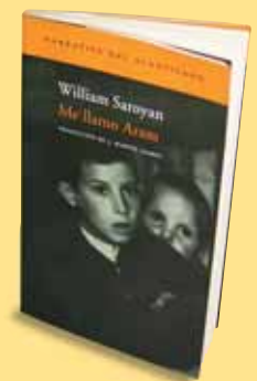
Me llamo Aram. William Saroyan. Narrativa del Acantilado. 152 páginas. 10 euros