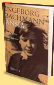
Ansia. Ingeborg Bachmann. Siruela. 128 páginas. 16 euros

Los cuentos de la escritora austriaca Ingeborg Bachmann se adentran en un terreno de semisombras y penumbras, en un ámbito onírico y dual donde afloran las grandes cuestiones existenciales, allí donde las apariencias se ven asaltadas por las últimas incertidumbres. Su escritura está marcada, como la de otros escritores contemporáneos suyos: Thomas Bernhard, Max Frisch o Paul Celán, por la II Guerra Mundial. Esta huella (ella tenía doce años cuando las tropas nazis entraron en su ciudad natal) da cierta desolación de fondo a todos sus relatos, siendo así que su lenguaje busca siempre explorar los límites de la conciencia. Estos relatos que ahora publica Siruela son todos ellos inéditos, algunos inacabados, lo cual no les resta interés, entre ellos está el último que dejó sin terminar cuando la muerte le sorprendió a los 44 años. Su obra ha sido galardonada en numerosas ocasiones, entre otros premios recibió el "Georg Buchner". Residió en Munich, Zurich y Roma, donde murió en 1973.