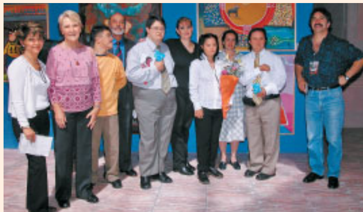
Responsables de la Fundación y alumnos participantes en la muestra expuesta en el Archivo General del Gobierno de Guanajuato en 2004 durante el XXXII Festival Internacional

Así, en 1997 se constituyó la Escuela Mexicana de Arte Down, con una formación amplia en