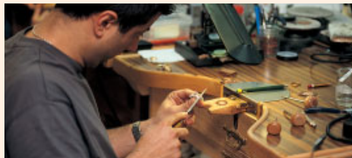
Un discapitado desarrollando su trabajo en un taller de oficios

Valencia, con 64 acciones, lidera la formación de 888 personas de las que 148 hallaron un puesto de trabajo. Alicante, con tres acciones, logró que veintisiete personas de las 48 que habían recibido formación del IVADIS en Alicante y otras 44