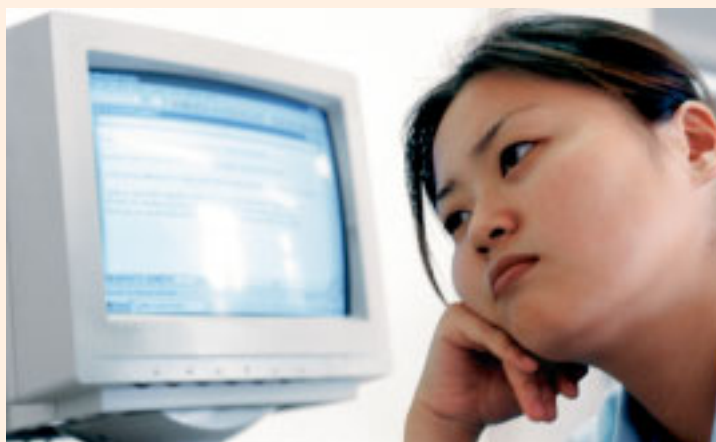
En la Declaración Europea se promueve la salud mental en la escuela y en el trabajo

Los representantes de los ministerios de Salud adquieren el compromiso de reforzar sus políticas de salud mental para dotar de estándares de calidad