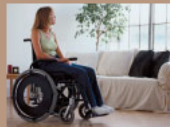
En La Rioja viven más de 150.000 personas con discapacidad que podrán beneficiarse de la regularización de la nueva Orden de Concesión de ayudas

Asimismo deberán justificar que, de no obtener el servicio, tratamiento o ayuda técnica, su discapacidad podría deteriorarse o agravarse.