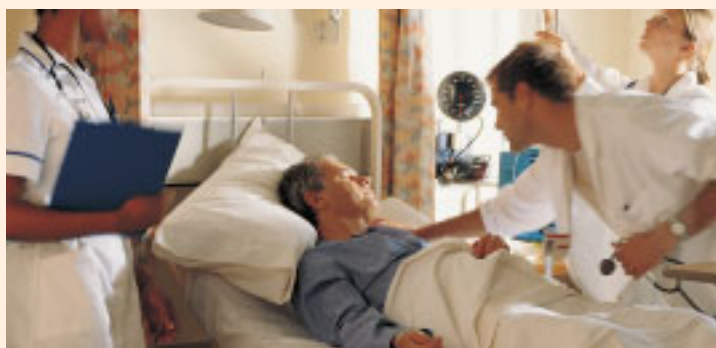
El Foro Español del Paciente promueve la defensa y el conocimiento de derechos de la persona enferma

La constitución de esta entidad tuvo lugar el pasado 9 de diciembre. Nace con el objetivo de promover la defensa y el conocimiento de los derechos de los pacientes a nivel local, autonómico, estatal y europeo con entidades con representación en los órganos de gobierno de las instituciones sanitarias que participan en políticas de salud, el desarrollo de campañas de comunicación específicas para pacientes y asociaciones de educación y formación, el diseño de investigaciones específicas y el establecimiento de estrategias de información personalizadas para grupos de pacientes.