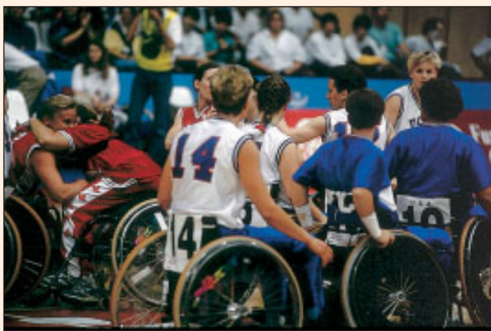
Equipo de jugadores de baloncesto en sillas de ruedas en una imagen de archivo

El programa ESTRELLA patrocina equipos que juegan