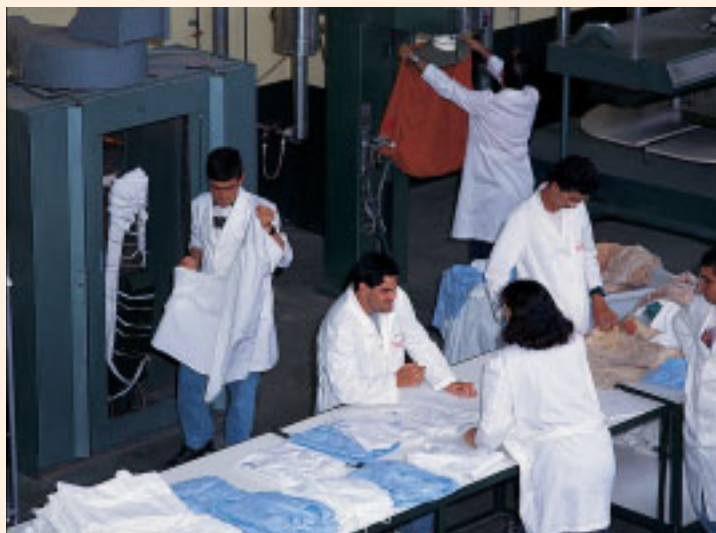
Trabajadores con discapacidad en el taller de planchado del Centro de Trabajo ALBA de AMICA

En la actualidad trescientas treinta personas, bien con discapacidad o que necesitan un apoyo