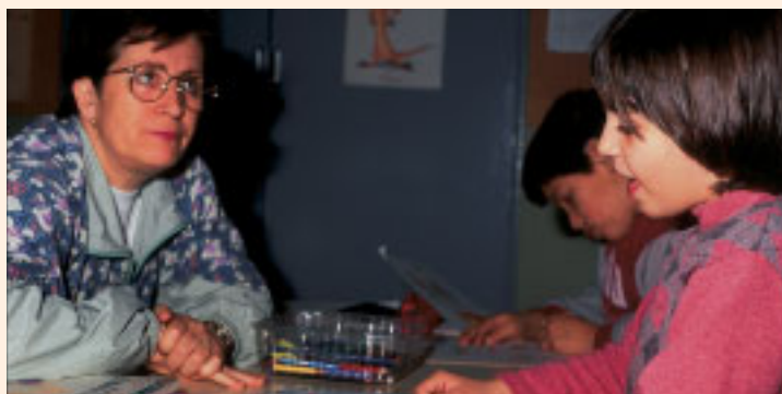
Los Premios Reina Sofía de Prevención de las Deficiencias recompensan la labor continuada de investigación y el trabajo sanitario