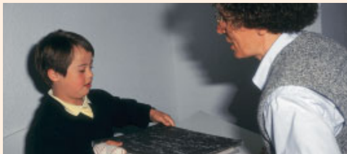
La colaboración de las familias es un factor clave en los programas de investigación

ñeros y una educación igual para chicos y chicas.