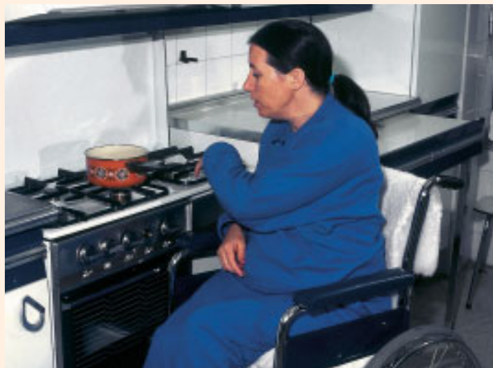
La concesión de ayudas favorece la implantación de la accesibilidad en el propio domicilio y la independencia

De esta forma se facilitará la elección del tipo de apoyo preciso para vivir y trabajar de forma autónoma en la comunidad. Se pretende simplificar el sistema de pensiones por discapaci-