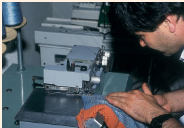
Más de 3.500 personas con discapacidad trabajan en empresas ordinarias gracias a los programas de empleo con apoyo

Inmediatamente, después vienen las Islas Baleares con su aportación del 21% en 9