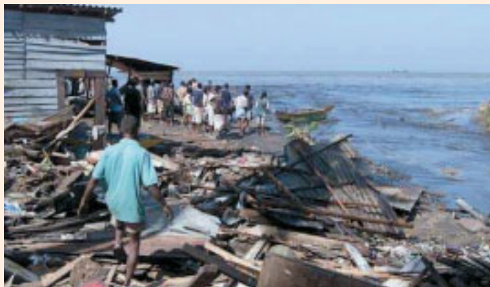
Aspecto devastado de una zona marítima en Sri Lanka

Durante el mes de enero, el PMA ha distribuido 2.299 toneladas métricas de alimentos llevados en camiones desde el puerto de Medan en Sumatra Norte en la costa oriental de Banda