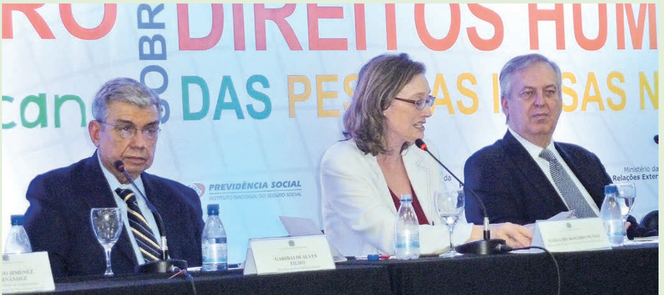
De izquierda a derecha, Garibaldi Alves Filho, ministro de Previsión Social, María do Rosário Nunes, ministra de estado responsable de los Derechos Humanos y Luiz Alberto Figueiredo Machado, ministro de Relaciones Exteriores, presideron la apertura del Encuentro .

ALT celebrada en San José de Costa Rica, durante los días 8 al 11 de mayo de 2012, para la evaluación del Plan de Madrid en la Región de ALT.