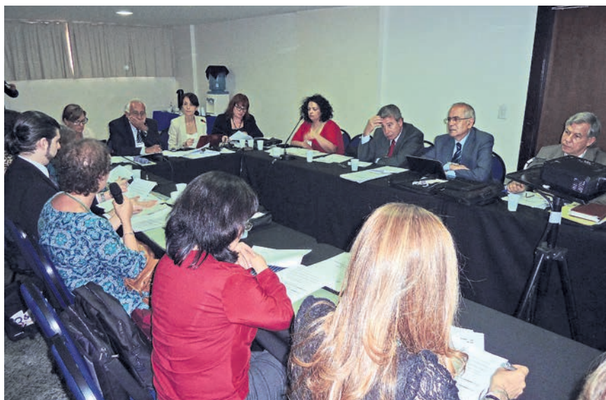
Un momento de los debates del III Encuentro Iberoamericano sobre Derechos Humanos de los Adultos Mayores en la región.

Es preciso citar, al respecto, antecedentes como la Declaración de Brasilia, el Grupo de trabajo de composición abierta sobre el envejecimiento, establecido por la