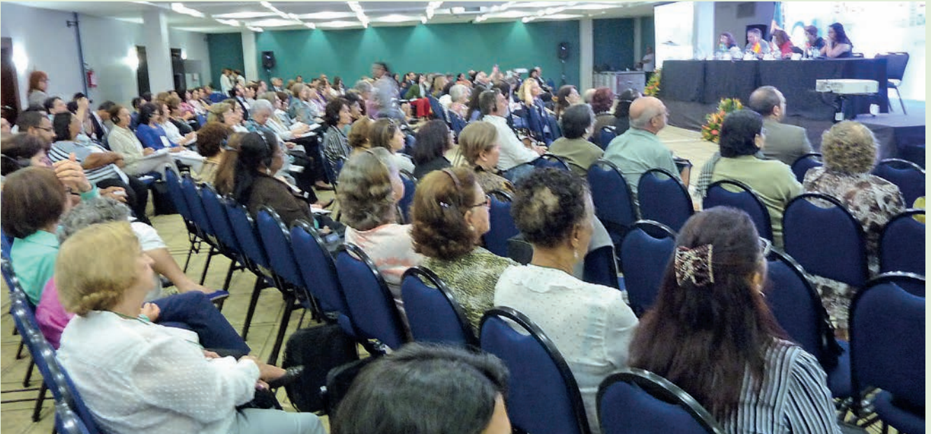
Reunión del plenario del Encuentro.