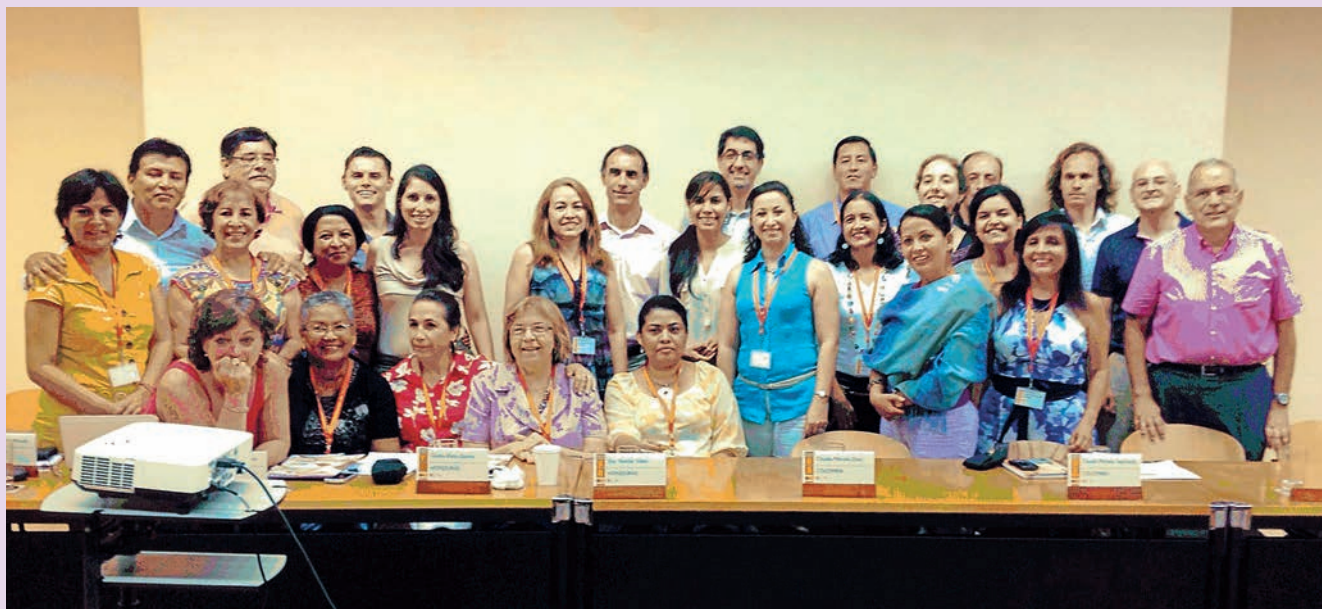
Grupo de asistentes al Seminario.

Aprendizaje y adaptación son, por lo tanto, dos procesos por los que han pasado distintos países en el desarrollo de sus políticas de atención a personas en situación de dependencia. En España lo sabemos bien, el desarrollo de los cuidados de larga duración no solo ha sido posible a partir de la capacidad instalada en los sistemas de servicios sociales y en el sistema de Seguridad Social sino también a partir del conocimiento acumulado de las experiencias de otros países en seminarios como el que aquí se describe. Ello nos pone en disposición de valorar la importancia de este tipo de iniciativas como inversiones más que como gasto, cuyos rendimientos no son tangibles en el corto plazo pero cuyos frutos acaban madurando en la experiencia y el desarrollo de políticas sociales de cuidados de larga duración de distinta intensidad según la situación de cada Estado que, en cualquier caso, a buen seguro supondrán un avance en la autonomía personal como un derecho humano fundamental en América Latina y el Caribe.