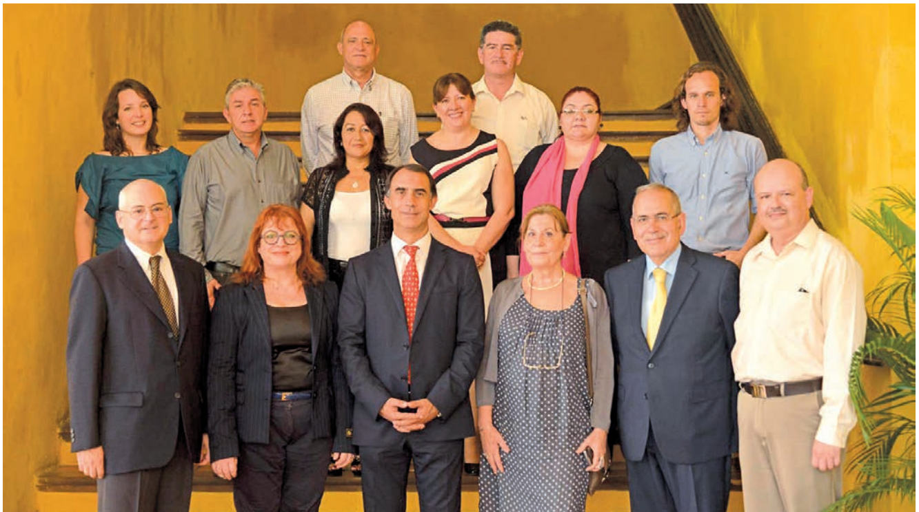
Participantes en la reunión de la Comisión Permanente de Riicotec.

Texto | Redacción Enlace/Riicotec