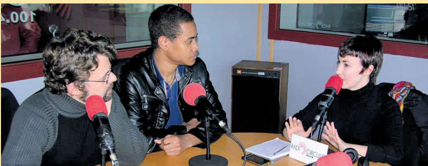
Autor y protagonista durante una entrevista radiofónica.

No tuvo una vida fácil, vivió con escasos recursos y bajo el prejuicio racial al ser mulato en una época de esclavitud. Su agitada vida finalizó en 1944, al ser fusilado en Matanzas acusado de formar parte de la conocida como Conspiración de la Escalera.