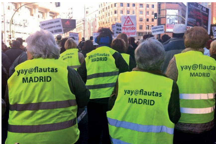
Mayores que participan activamente.

Son muchos los cauces de participación que nuestros mayores actuales están utili-