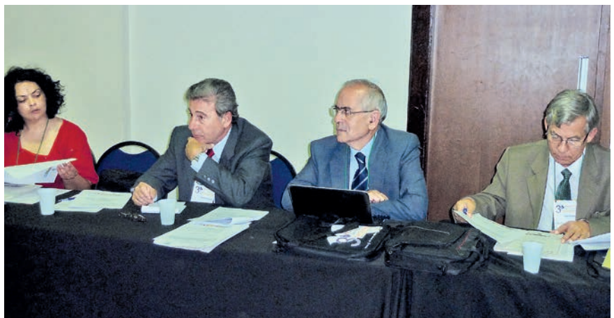
Representantes de países participantes en el Encuentro.

Presidieron su inauguración Maria do Rosário Nunes, Ministra de Estado Responsable de los Derechos Humanos; Eleonora Menicucci, ministra de estado responsable de la Secretaria de Políticas para las Mujeres de la Presidencia de la República; Luiz Alberto Figueiredo Machado, ministro de Relaciones Exteriores;