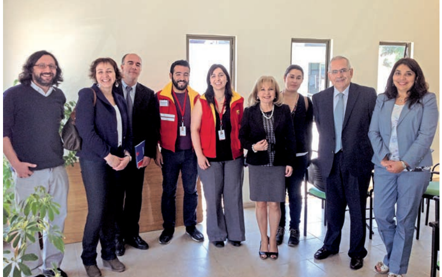
Visita al centro KINTUN.

Se ha optado por una política de centros de día cuyo objetivo principal es la prevención de la situación de dependencia, de manera que los adultos mayores sigan teniendo la mayor funcionalidad posible. No se trata de centros de día de carácter asistencial, sino de centros en los que se promueve la rehabilitación y la prevención de un agravamiento de la dependencia ”