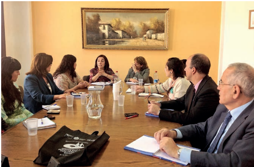
Reunión del equipo técnico del Senama con los expertos españoles.

En el ámbito de los servicios sociales para adultos mayores, ha de decirse que, en la mayor parte de las municipalidades y comunas del país, existen centros y clubes para adultos mayores autovalentes. Son un lugar de encuentro de adultos mayores activos, con mayor o menor periodicidad, para el desarrollo de actividades recreativas, lúdicas, culturales o de ocio. También se encuentran en funcionamiento establecimientos de larga estadía (Eleam) para adultos mayores en situación de dependencia severa, con enfermedades muy invalidantes (tipo Alzheimer o similares) y para adultos mayores postrados.