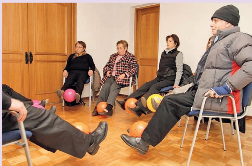
Ejercicios conjuntos de kinesiología en un centro de día para adultos mayores dependientes de Chile (página web del Senama).