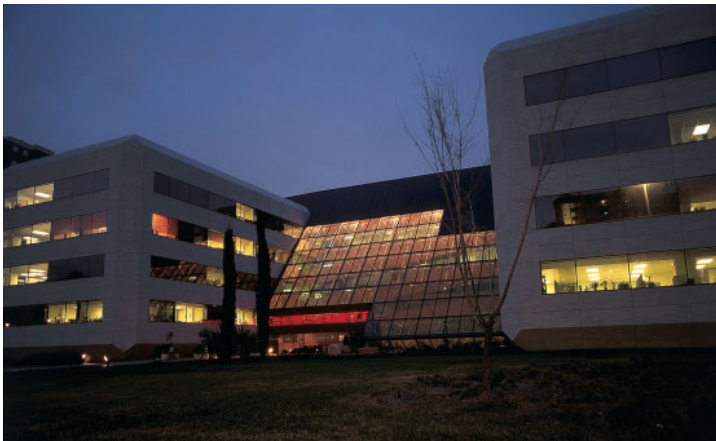
Vista nocturna de la sede central del IMSERSO, que a partir de ahora pasa a denominarse Instituto de Mayores y Servicios Sociales

El Consejo de Ministros ha aprobado en su reunión de 2 de julio, a propuesta de los ministros de Administraciones Públicas y Trabajo y Asuntos Sociales (MTAS), un Real Decreto por el que se desarrolla la nueva estructura orgánica básica del Departamento que dirige Jesús Caldera.