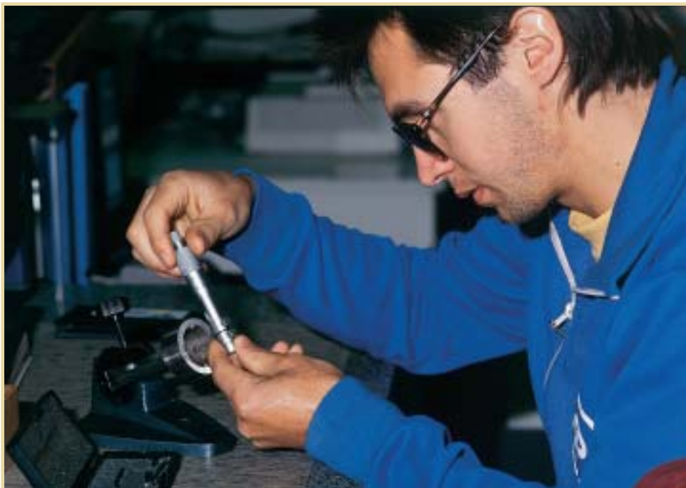
El segundo Área del Plan incluye 95 propuestas de actuación estructuradas en torno a cuatro estrategias: contra la discriminación, a favor de la mejora de la empleabilidad, por más y mejores empleos y por medidas activas y preventivas

Las 99 medidas contenidas en este área pretenden servir de apoyo al desarrollo de los preceptos contenidos al respecto tanto en la Ley 51/2003, de 2 de diciembre, de Igualdad de oportunidades, no-discriminación y accesibilidad universal de las personas con discapacidad, como en las líneas de actua-