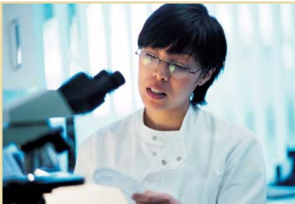
El II Plan de Acción fomentará la innovación y el desarrollo de la calidad en el sector de la discapacidad a través de actuaciones y medidas de ámbito estatal

En la Estrategia de Apoyo a Familias se pretende desarrollar todo un conjunto de prestaciones técnicas y de servicios de apoyo para las familias cuidadoras de per-