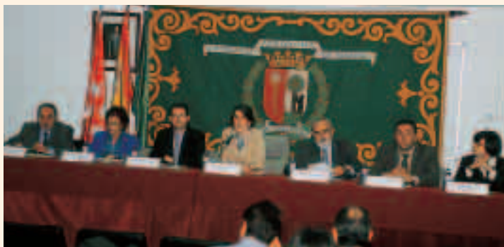
Aspecto de la mesa presidencial durante la ceremonia de inauguración del máster

El programa comprende varios módulos: aspectos conceptuales, metodológicos y legales, valoración de las deficiencias somáticas, valoración