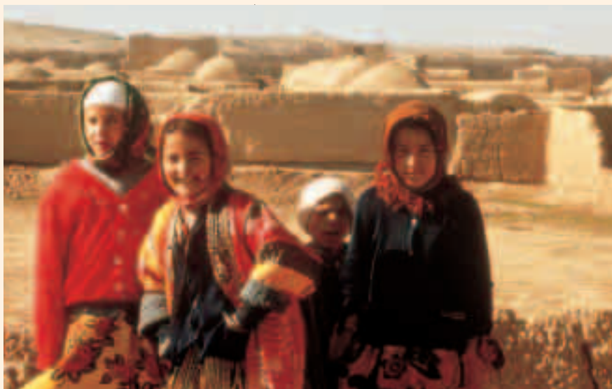
Niñas afganas refugiadas, mudos testigos de la tragedia en su país

Con el triunfo de la Alianza del Norte parece que la guerra finalizó en Afganistán, país del que hasta hace muy poco sólo conocíamos sus más de 20 años de guerra con Rusia y por tener un subsuelo plagado de minas como Camboya. Según datos de Cruz Roja más de 10 millones de personas han perdido algún miembro en la última década por estos artefactos que causan a diario 25 muertos.