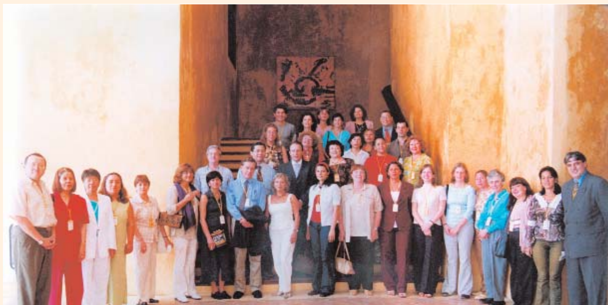
Foto 2: Abuso y maltrato a las personas mayores (Cartagena de Indias)