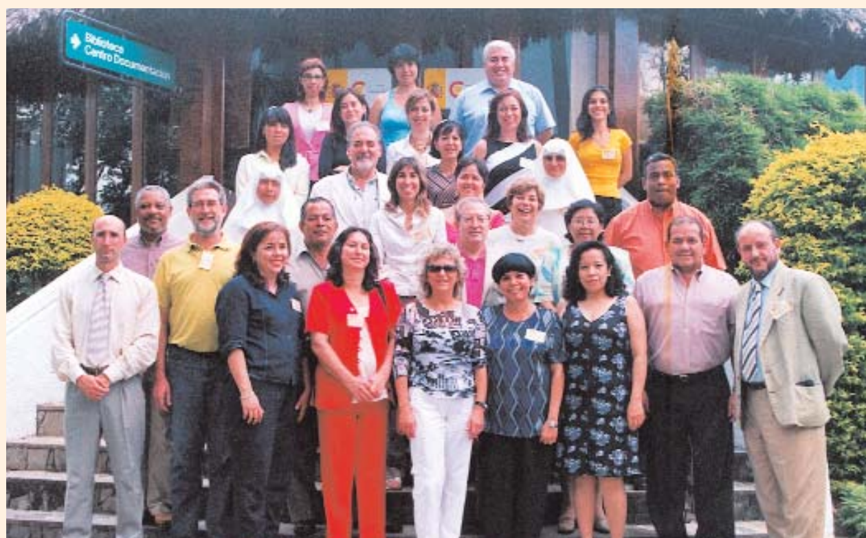
Foto 3: Nuevos modelos de residencias para personas mayores (Santa Cruz de la Sierra)