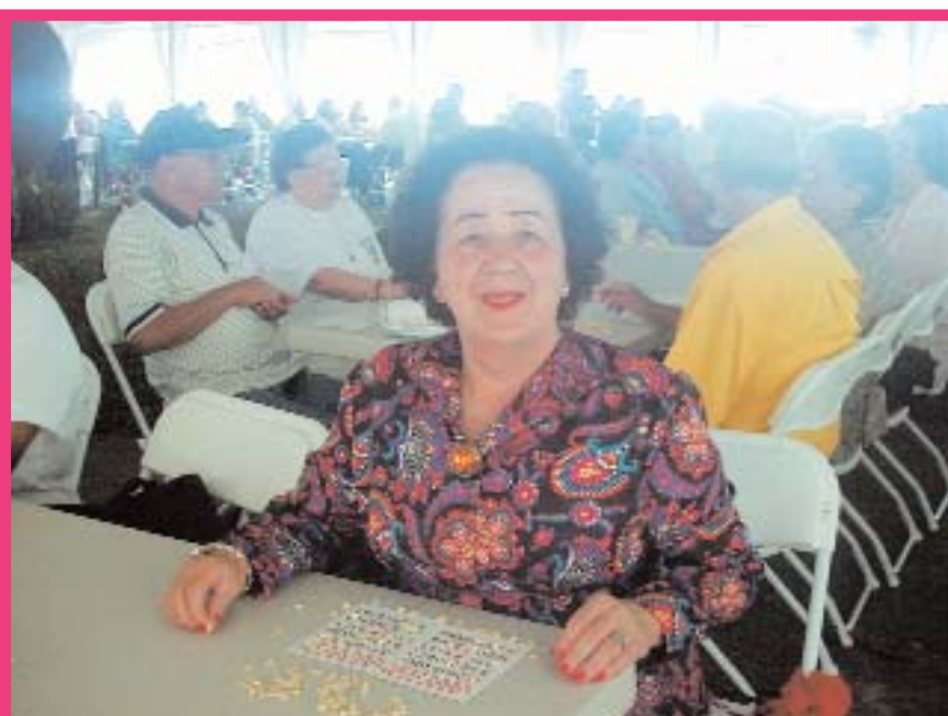
Octubre del 2004, el CONAPAM organizó la III Feria Nacional de la Persona Adulta Mayor, una de las actividades más importantes del país para esta población.

“ La igualdad de oportunidades condena la discriminación por razones de edad; la dignidad para ser tratadas con respeto y consideración; la participación en la vida social, económica, política y cultural del país y la permanencia en el núcleo familiar y comunitario. ”