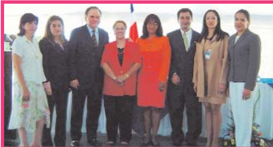
Miembros de la Comisión para la redacción del Código de la vejez

del Código de la Vejez entre a la corriente legislativa, ya que se trata de una iniciativa de indiscutible trascendencia que está respaldada por el Ejecutivo y goza del apoyo manifiesto de un grupo considerable de diputados.