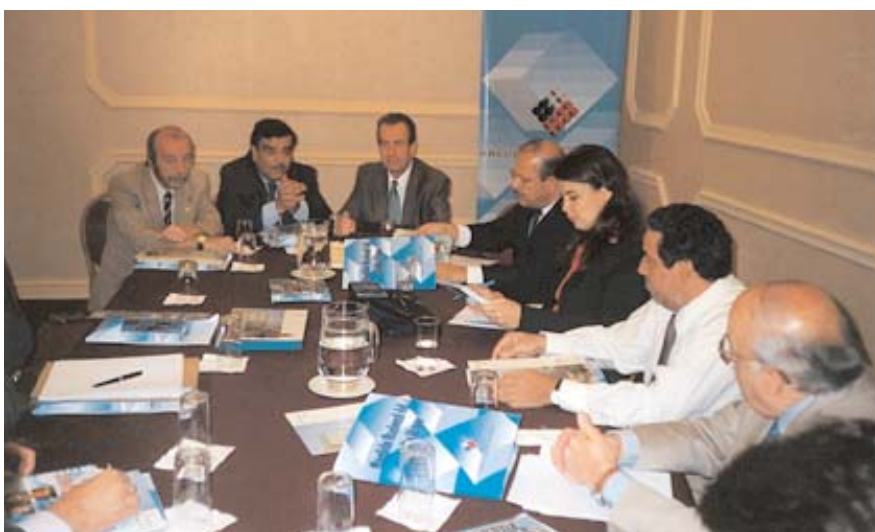
Reunión de la XX Comisión Permanente

Por acuerdo de la VII Conferencia de la RIICOTEC celebrada en Acaapulco, México, en Octubre de 2003, la VIII Conferencia celebrada en Santiago de Chile, aprobó su celebración en Natal, de entre el ofrecimiento de varias ciudades, teniendo en cuenta la accesibilidad con que cuenta la misma, del 3 al 7 de Octubre de 2005.