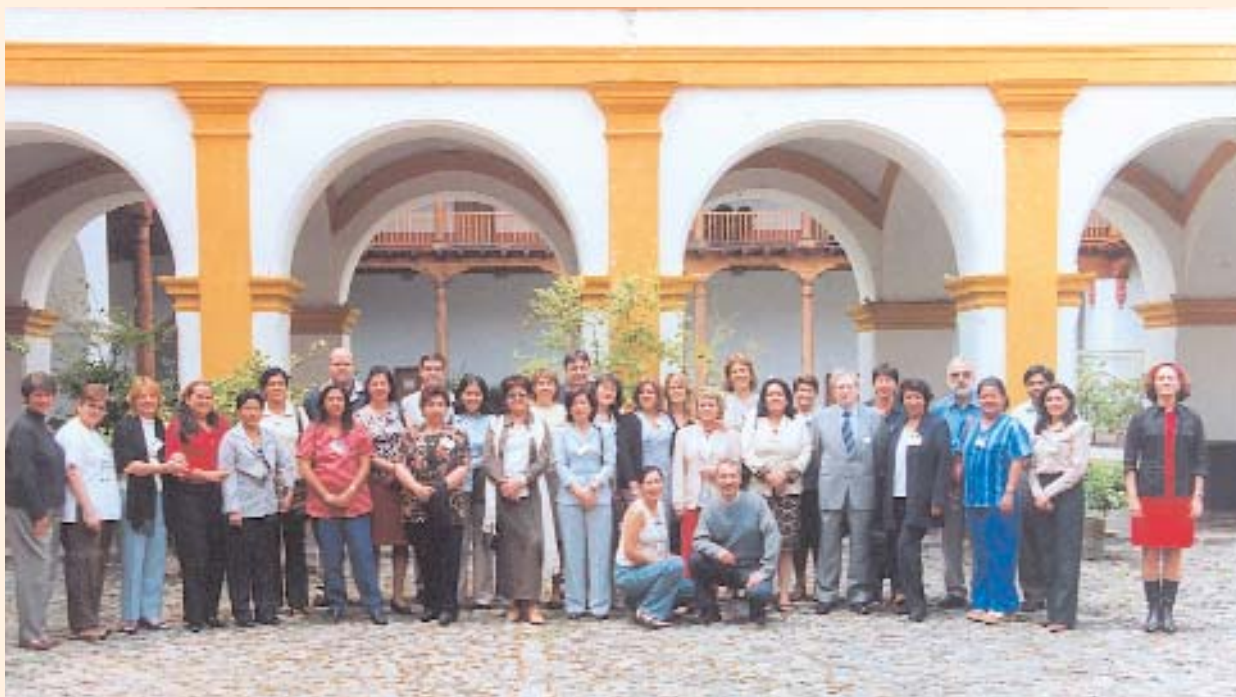
Foto 1: Envejecimiento activo y programas de Intervención gerontológica en contextos rurales (La Antigua)