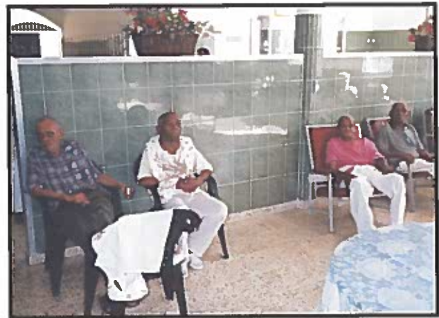
Adultos mayores del Hogar de Ancianos San Francisco de Asís, de Santo Domingo (República Dominicana).

Por todo ello, una política sobre dependencia tiene que considerar las múltiples necesidades a las que se enfrentan los adultos mayores, para lo que habrá que generar acciones diferenciadas. La experiencia española puso de manifiesto, respecto del roles del Estado, la familia