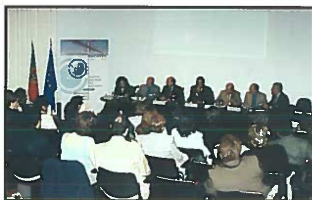
Fue significativa la presencia de representantes de instituciones y asociaciones iberoamericanas de discapacidad y adulto mayor.