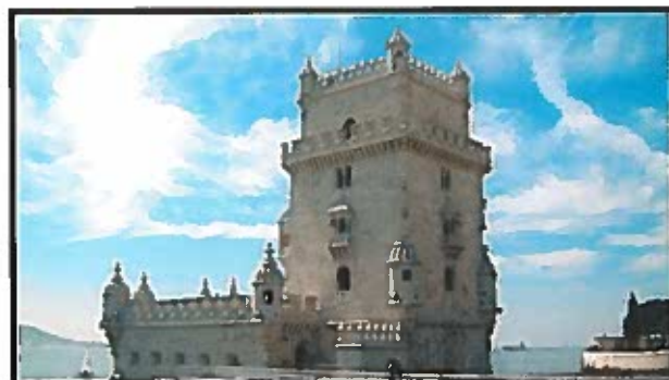
La VI Conferencia de Lisboa se desarrolló en un apretado programa durante tres días. En la foto, la famosa Torre de Belém lisboeta.