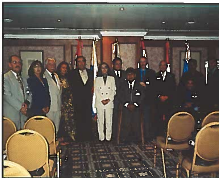
Participantes en la reunión de Caracas entre las contrapartes de la Región Andina (Ecuador, Colombia, Venezuela, Perú y Bolivia) y la Secretaría Ejecutiva.

La primera ha sido la encargada principalmente de la infraestructura de la Conferencia (lugar de celebración y de alojamiento de los participantes, recursos materiales y necesarios, etc.). La Secretaría Ejecutiva, por su parte, ha llevado a cabo, entre otras cuestiones, el proceso de acreditación de los participantes (información sobre los departamentos ministeriales competentes, solicitud de acreditación de representantes, remisión de la convocatoria); la elaboración del programa de actividades de la Conferencia y de la memoria de actividades del periodo y la recopilación y envío de la documentación que iba a entregarse en Lisboa.