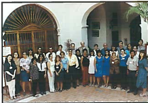
Alumnos del curso de Formación y Supervisión de Proyectos en Gerontología.