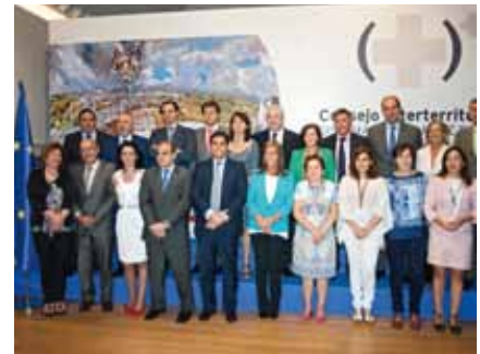
6/7 LA NOTICIA