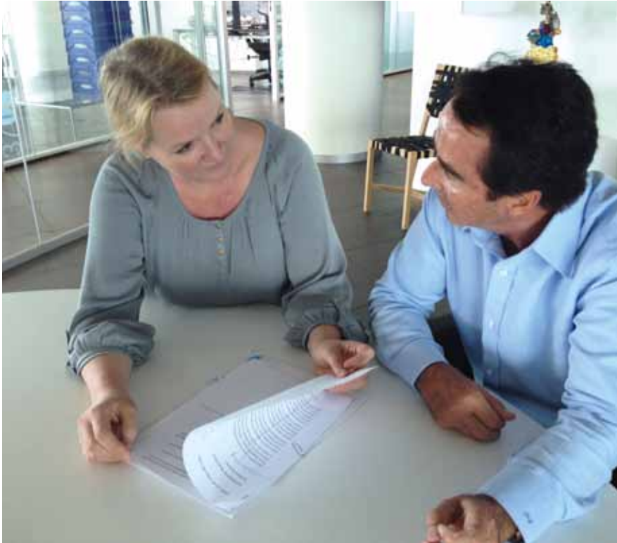
El equipo de la Agregaduría de Asuntos Sociales está compuesto solo por 4 personas

60 y 70 a Holanda. El 95% de estos emigrantes volvió a España. Ahora esta generación está llegando a la edad de pensionista. Los jubilados tienen derecho a una pensión estatal de AOW holandesa. La mayoría de los emigrantes españoles retornados tiene una pensión de Holanda y una pensión de España, según los años cotizados. Algunos de los españoles que han trabajado en Holanda también han cotizado en fondos privados y reciben una pensión de estos fondos, como por ejemplo el fondo de pensiones de los marineros, el fondo de pensiones de Hoogovens (Altos Hornos), el fondo de Philips, etc.