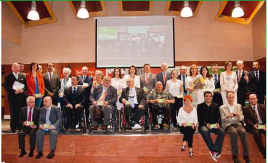
Foto de familia de los premiados