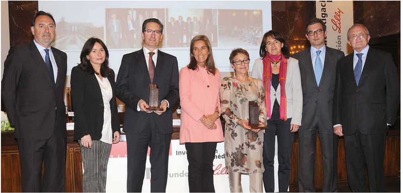
Foto de familia de la ministra Ana Mato con los galardonados

En el tratamiento de enfermedades graves, como el cáncer, “el objetivo que perseguimos todos los que trabajamos en este campo es conseguir que los ciudadanos dispongan de los mejores tratamientos lo antes posible, y hacer esto compatible con la necesaria sostenibilidad del sistema sanitario”. Así lo señaló la ministra de Sanidad, Servicios Sociales e Igualdad, Ana Mato, en su intervención en la entrega de los Premios de la Fundación Lilly a la Investigación Biomédica 2014, el pasado mes de mayo.