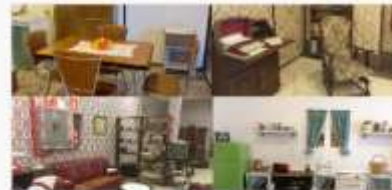
1. BP CuidAs: Sala de Reminiscencias Residencia Colisee Plaza Real. Gijón. Colisee. Principado de Asturias.