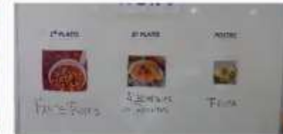
2. BP CuidAs: Comiendo por los ojos Centro Polivalente de Recursos "La Tenderina", Oviedo. ERA. Consejería de Derechos Sociales y Bienestar del Principado de Asturias.